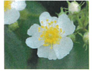
古今集に詠まれた 庚申バラ