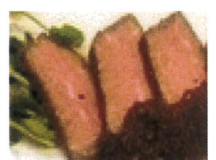
美味しいローストビーフがおススメ！