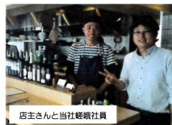
店主さんと当社嵯峨社員